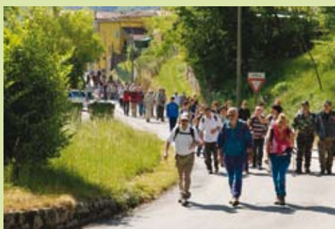
6 Maggio 2007 1 ^ Escursione Campo-Schievenin