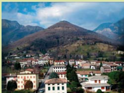
"Col del Roro" Campo di Alano di Piave (BL)

delle province di Belluno e Treviso e dei Comuni di Alano di Piave, Quero, Asolo, Castello di Godego, Cavaso del Tomba, Cornuda, Follina, Istrana, Miane, Montebelluna, Paese, Pederobba, Ponzano Veneto, Povegliano, Segusino, Trevignano, Valdobbiadene