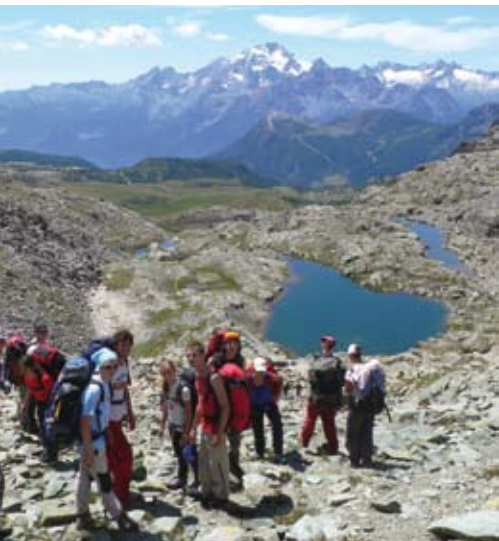
Laghetti di Campagneda con il Monte Disgrazia