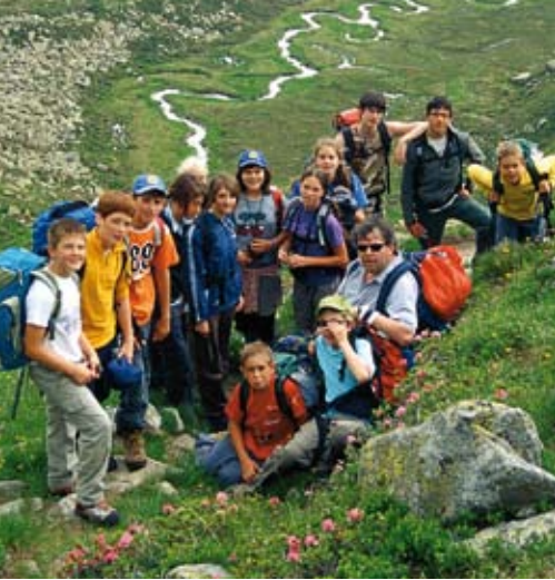
Ritorno dal Waldnersee