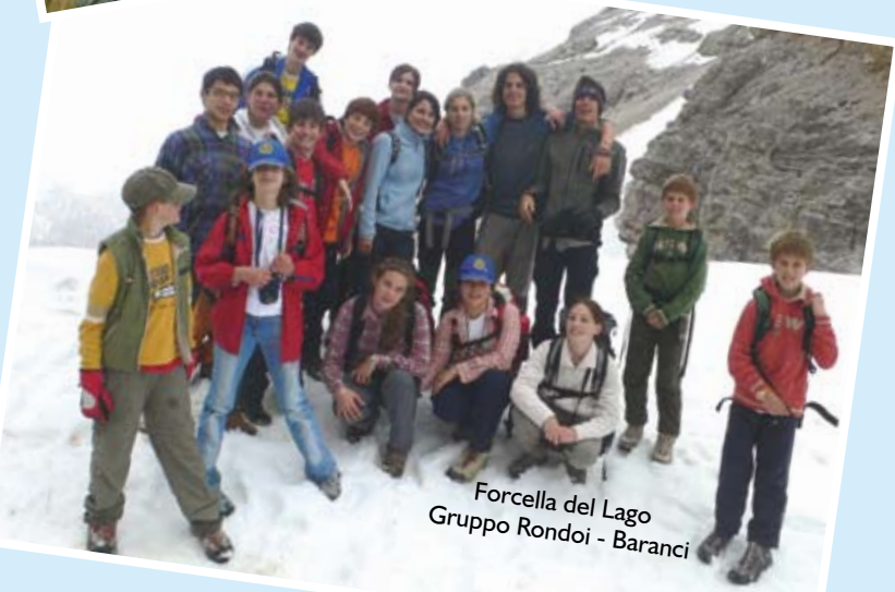
Forcella del Lago Gruppo Rondoï - Baranci