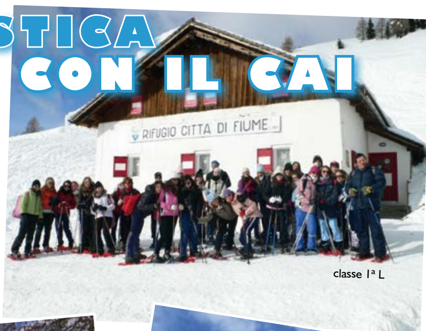
classe 1 a L