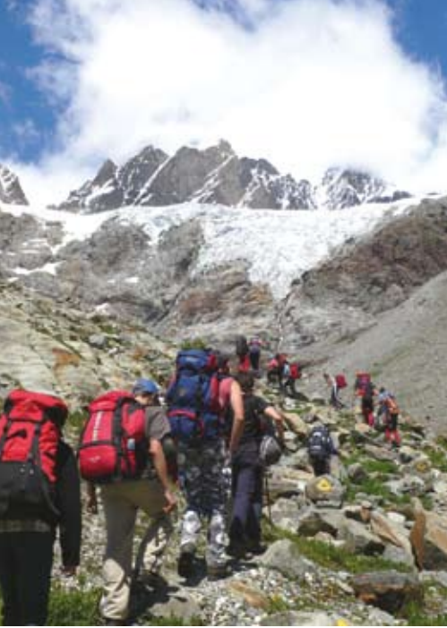
Sotto la Vedretta dello Scerscen