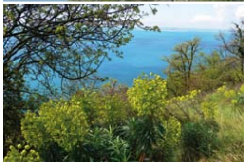
Sentiero Kugy - Carso Triestino Liceo Scientifico Marconi - Conegliano