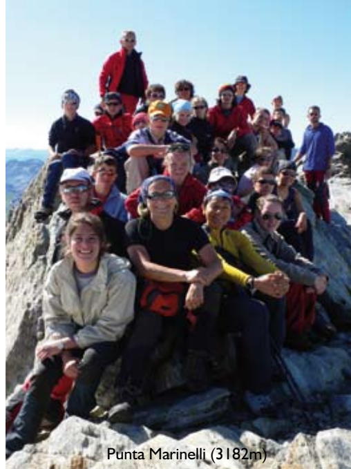
Punta Marinelli (3182m)

Anche oggi è una bellissima giornata: saliamo una conca parzialmente innevata verso il Passo Marinelli orientale. Siamo ora su un ghiacciaio immacolato a circa 3000 metri di quota. Questo paesaggio è più simile al paradiso che alla terra! Lasciati gli zaini ai piedi di una cresta, iniziamo a salire su placche rocciose fino a raggiungere la vetta, la Punta Marinelli (3182m), massima quota di tutto il nostro trekking. Da qui ammiriamo un fantastico panorama sul Pizzo Bernina (4049m), sul ghiacciaio dello Scerscen, sul ghiacciaio di Fellaria. Scendiamo quindi il ghiacciaio per circa un'ora, dopo di che ci concediamo una lunga pausa pranzo nei pressi di un incantevole laghetto. Infine raggiungiamo il Rif. Bignami (2401m) e ci rilassiamo sui prati circostanti.