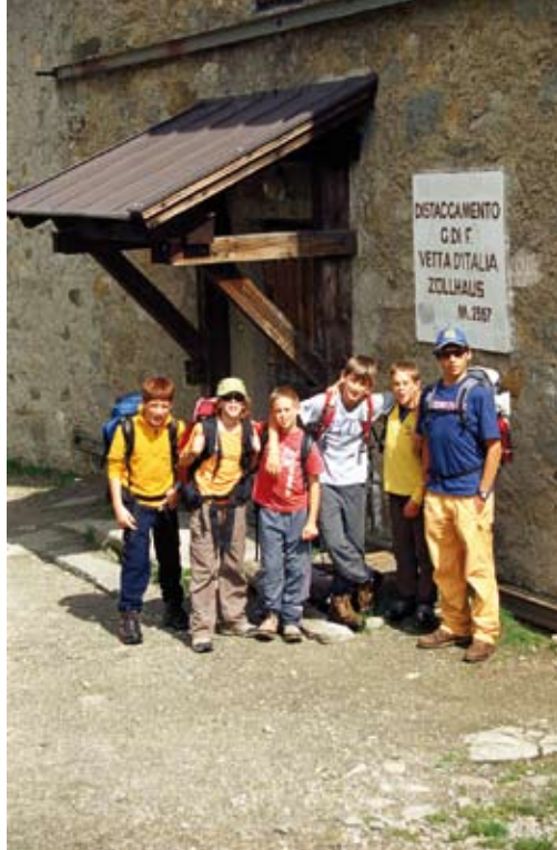
Rifugio Vetta d'Italia