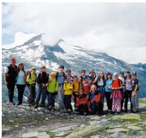
Passo dei Tauri