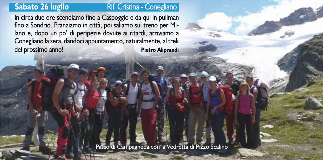
Passo di Campagneda con la Vedretta di Pizzo Scalino