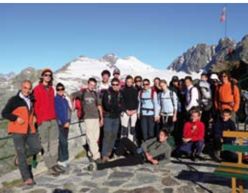
Il gruppo al Rifugio Marinelli