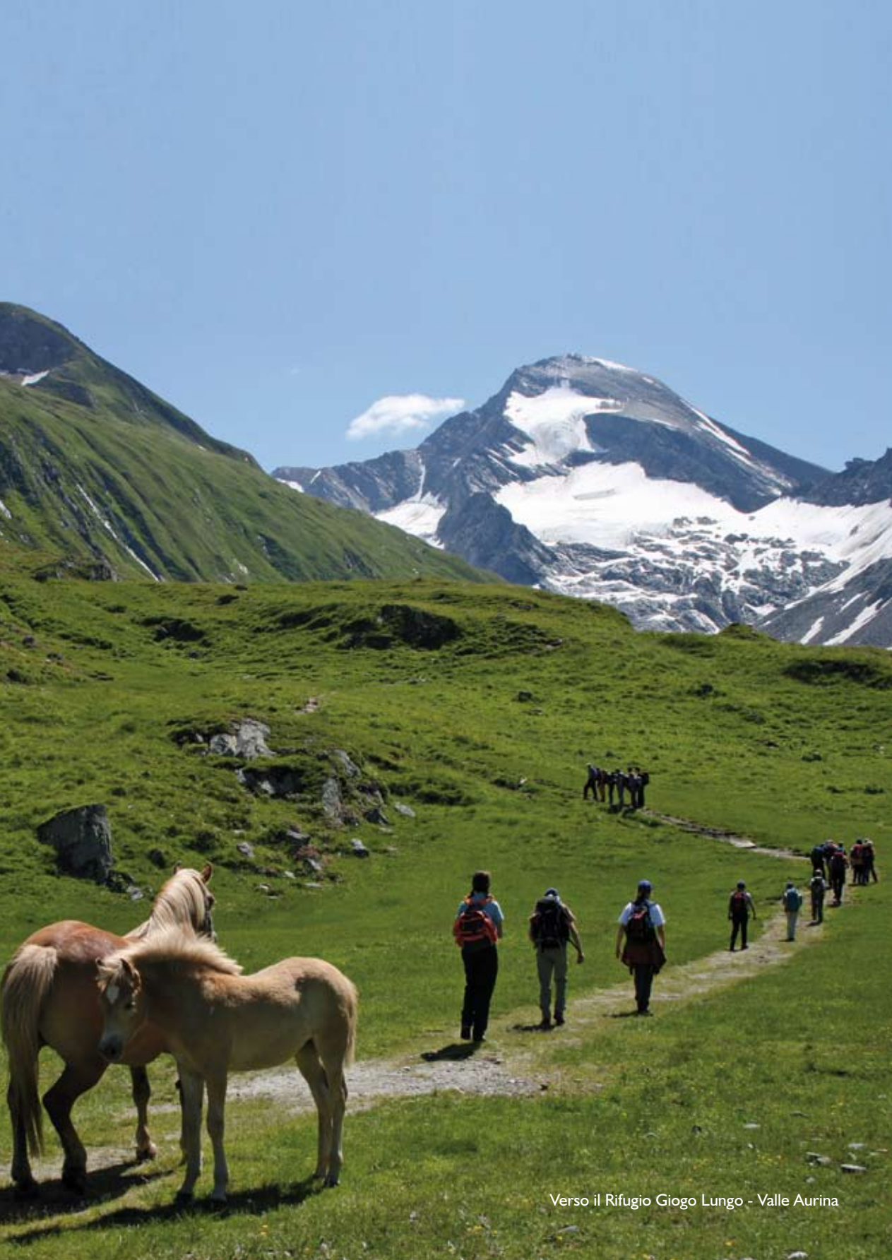
Verso il Rifugio Giogo Lungo - Valle Aurina