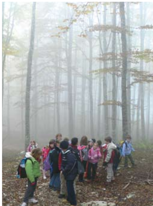
Scuola Kennedy cl. 3 a - Conegliano