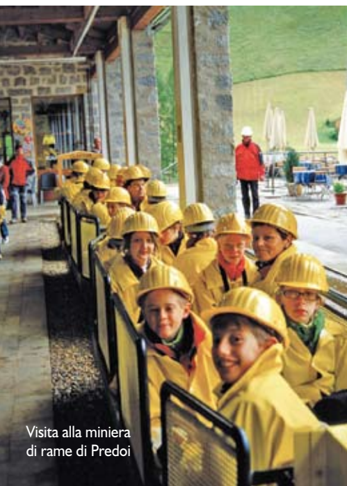
Visita alla miniera di rame di Predoi