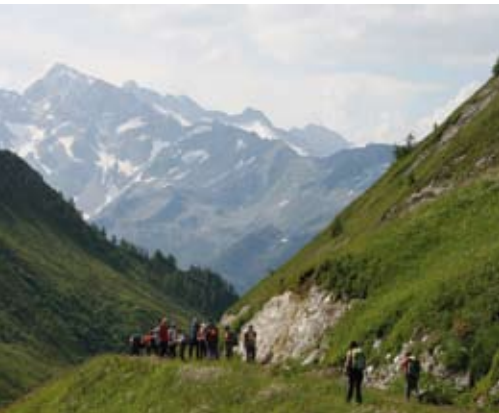
Valle della Lepre